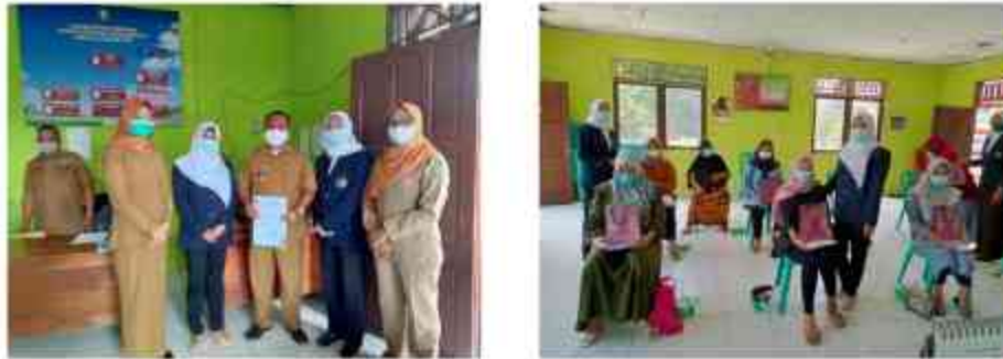
Gambar 6. Pemberian Souvenir dan Foto Bersama

dengan pihak-pihak terkait seperti puskesmas dan profesi lain (dokter dan ahli gizi, dll) dalam upaya peningkatan kesehatan secara holistic.