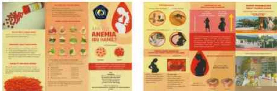
Gambar 3. Leaflet Penyuluhan Anemia Kehamilan

Program pengabdian kepada masyarakat yang berupa pemeriksaan kesehatan, konseling dan penyuluhan kesehatan mengenai "Pengetahuan Anemia pada Ibu Hamil", dapat meningkatkan pengetahuan ibu hamil tentang : Tanda-tanda anemia pada ibu hamil, bagaimana cara pencegahannya dan bagaimana dapat penanganan di rumah dan melalui kegiatan ini ibu hamil dapat mengambil keputusan dalam memanfaatkan fasilitas layanan kesehatan di masyarakat khususnya Desa Hilir Kota dalam upaya meminimalkan angka kekurangan zat besi pada ibu hamil akibat Anemia. Hal tersebut terbukti dari Rekap hasil Kuesioner sebelum dan sesudah diberikan penyuluhan. Sebelum diberikan penyuluhan sebanyak 4 peserta (27%) dengan pengetahuan Baik dan setelah kegiatan terdapat peningkatan menjadi 12 peserta (80%) dengan pengetahuan Baik. Hal ini menunjukkan peserta sangat antusias untuk meningkatkan pengetahuan mereka tentang pencegahan anemia pada ibu hamil.