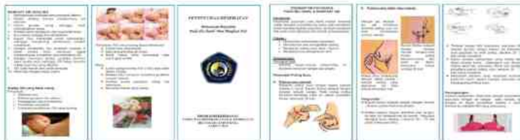
Gambar 4. Leaflet Penyuluhan Nutrisi Kehamilan