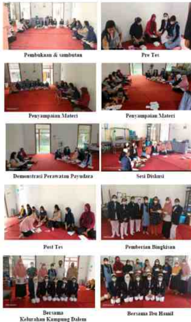
Gambar 2. Kegiatan Penyuluhan

Program pengabdian kepada masyarakat yang berupa pemeriksaan kesehatan, konseling dan penyuluhan kesehatan mengenai "Teknik Perawatan Payudara dan Manfaat ASI", dapat meningkatkan pengetahuan ibu hamil tentang : pengertian perawatan payudara, tujuan perawatan payudara; manfaat perawatan payudara, pengertian ASI, manfaat ASI, persiapan alat perawatan payudara dengan lengkap dan benar dan melaksanakan cara perawatan payudara dengan benar [7]. Melalui kegiatan ini ibu hamil dapat mengambil keputusan dalam memanfaatkan fasilitas layanan kesehatan di masyarakat khususnya di Kelurahan Kampung Dalem kota Kediri dalam upaya memaksimalkan cakupan ASI eksklusif. Hal tersebut terbukti dari Rekap hasil Kuesioner sebelum dan sesudah diberikan penyuluhan [8]. Sebelum diberikan penyuluhan sebanyak 3 ibu hamil (30%) dengan pengetahuan baik dan setelah kegiatan terdapat peningkatan menjadi 8 ibu hamil (80%) dengan pengetahuan baik. Hal ini menunjukkan peserta sangat antusias untuk meningkatkan pengetahuan mereka tentang pentingnya edukasi teknik perawatan payudara dan manfaat ASI [9].