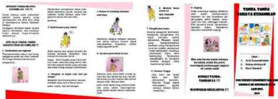
Gambar 5. Leaflet Penyuluhan Tanda bahaya Kehamilan lanjut

Saat sesi diskusi ibu hamil sangat antusias terhadap penyampaian materi yaitu ada 3 ibu hamil yang mengajukan pertanyaan. Pertanyaan Pertama di sampaikan Oleh Ibu Siti harun "Bagaimana cara mengatasi bila gerakan janin berkurang?" dan dijawab oleh Mahasiswa Wulandari : "Cara mengatasi bila gerakan janin kurang yaitu dengan cara beristirahat yang cukup, nutrisi yang cukup, menyentuh atau mengelus perut sambil mengajak janin berbicara, berbaring dengan posisi kiri untuk memperlancar oksigen ke janin" Pertanyaan oleh ibu Ika Puji "Apa yang menyebabkan terjadinya demam pada ibu hamil? Pertanyaan di jawab oleh Mahasiswa Husnul Quriah : "Demam disebabkan karena adanya infeksi. Infeksi saat hamil bisa terjadi akibat banyak penyakit, misalnya infeksi saluran kemih, infeksi saluran pernapasan, demam tiroid, hingga infeksi pada ketuban". Pertanyaan ke Tiga di sampaikan oleh ibu Sriannah "Apa tanda dan gejala ibu Hamil Dengan Eklampsia?" Pertanyaan di Jawab oleh Mahasiswa Sariyati Molo : "Tanda tanda/gejala eklamsia : tekanan darah yang semakin tinggi, sakit kepala yang semakin parah, mual dan muntah, sakit perut bagian kanan atas, tangan dan kaki bengkak, gangguan penglihatan, frekuensi dan jumlah urine berkurang, peningkatan kadar protein, dan disertai dengan kejang".