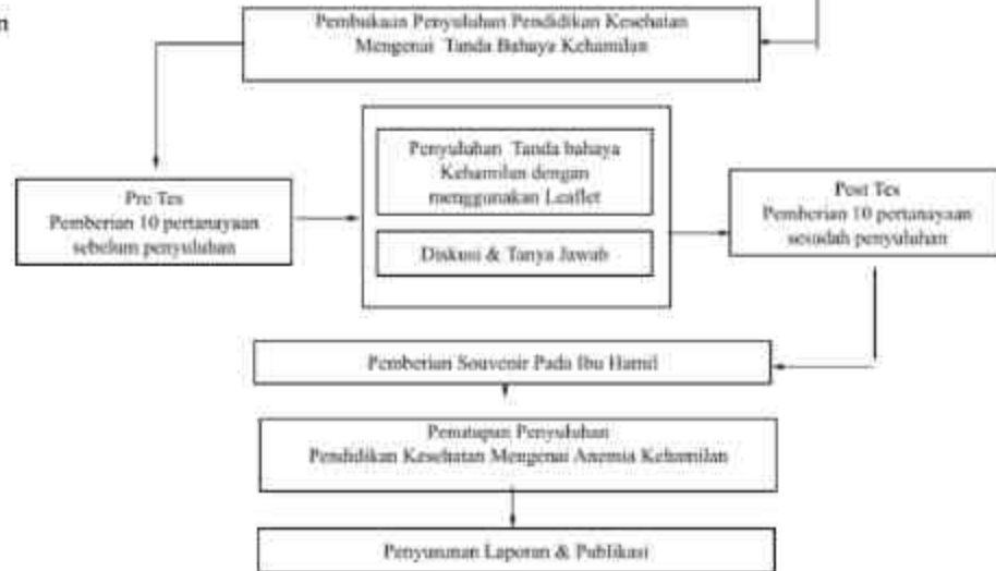
Gambar 1. Tahap Kegiatan Pengabdian Masyarakat