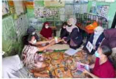
Gambar 4. Pemberian Ucapan Terimakasih