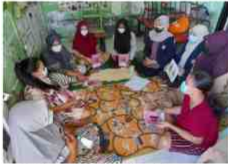
Gambar 3. Kegiatan Penyuluhan