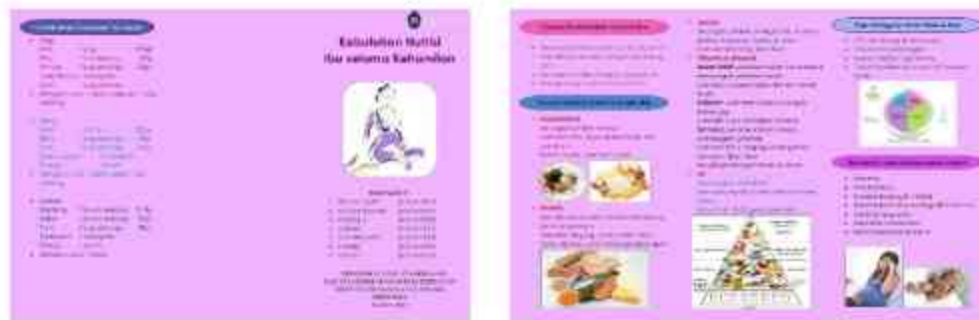
Gambar 3. Leaflet Penyuluhan Nutrisi Kehamilan

Program pengabdian kepada masyarakat yang berupa pemeriksaan kesehatan, dan penyuluhan kesehatan mengenai "Pengetahuan Nutrisi pada Ibu Hamil", dapat meningkatkan pengetahuan ibu hamil tentang: Gizi seimbang untuk ibu hamil [12]. Manfaat gizi seimbang untuk ibu hamil, Masalah yang berhubungan dengan gizi ibu hamil, Kebutuhan nutrisi pada ibu hamil, Menu Seimbang pada ibu hamil, Tanda dan gejala kurangnya nutrisi pada ibu hamil dan Pengaruh keadaan Gizi terhadap proses persalinan [13]. Melalui kegiatan penyuluhan ini ibu hamil dapat mengambil keputusan dalam memanfaatkan fasilitas layanan kesehatan bagi masyarakat khususnya Klinik Kartika Husada Desa Donomulyo Malang dalam upaya meminimalkan kekurangan nutrisi pada ibu hamil. Hal tersebut terbukti dari Rekap hasil Kuesioner sebelum dan sesudah diberikan penyuluhan [14]. Sebelum diberikan penyuluhan sebanyak 3 ibu hamil (30%) dengan pengetahuan Baik dan setelah kegiatan terdapat peningkatan menjadi 8 ibu hamil (80%) dengan pengetahuan Baik [15]. Hal ini menunjukkan peserta sangat antusias untuk meningkatkan pengetahuan tentang pentingnya nutrisi pada ibu hamil.