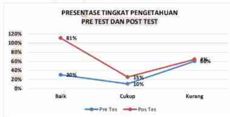
Gambar 3. Presentase Tingkat Pengetahuan Peserta Sebelum dan Sesudah Mengikuti kegiatan Webinar

Setelah diadakan webinar (Post Tes) terjadi peningkatan pengetahuan. Ini dapat kita perbandingan hasil post test Pengetahuan Baik sebanyak 39 orang (81%), Pengetahuan Cukup 7 Orang (15%) dan Pengetahuan Kurang sebanyak 2 orang (4%). Terjadi peningkatan pengetahuan mengenai definisi Covid, Gejala, Populasi Resiko terkena, Peran Kader Kesehatan dan Cara Pencegahan di masa pandemic Covid 19 bertambah setelah mengikuti kegiatan Webinar.