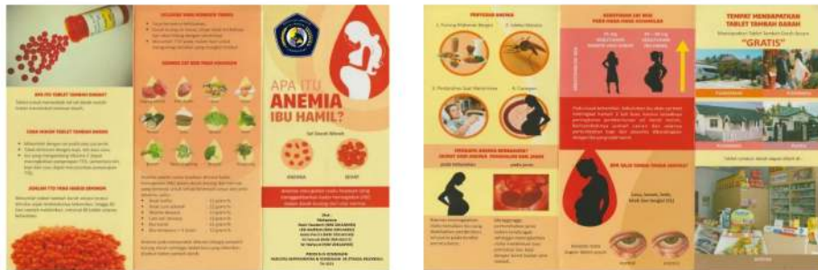
Gambar 3. Leaflet Penyuluhan Anemia Kehamilan

Program pengabdian kepada masyarakat yang berupa pemeriksaan kesehatan, konseling dan penyuluhan kesehatan mengenai "Pengetahuan Anemia pada Ibu Hamil", dapat meningkatkan pengetahuan ibu hamil tentang tanda-tanda anemia pada ibu hamil, bagaimana cara pencegahannya dan bagaimana dapat penanganan di rumah dan melalui kegiatan ini ibu hamil dapat mengambil keputusan dalam memanfaatkan fasilitas layanan kesehatan di masyarakat khususnya Desa Hilir Kota dalam upaya meminimalkan angka kekurangan zat besi pada ibu hamil akibat Anemia. Hal tersebut terbukti dari Rekap hasil Kuesioner sebelum dan sesudah diberikan penyuluhan. Sebelum diberikan penyuluhan sebanyak 4 peserta (27%) dengan pengetahuan Baik dan setelah kegiatan terdapat peningkatan menjadi 12 peserta (80%) dengan pengetahuan Baik. Hal ini menunjukkan peserta sangat antusias untuk meningkatkan pengetahuan mereka tentang pencegahan anemia pada ibu hamil.