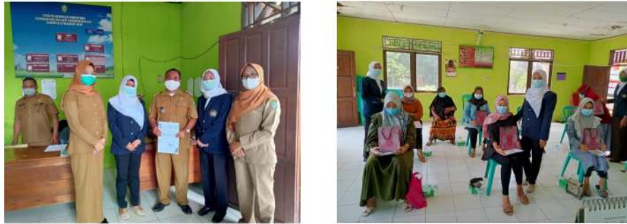
Gambar 6. Pemberian Souvenir dan Foto Bersama

dengan pihak-pihak terkait seperti puskesmas dan profesi lain (dokter dan ahli gizi, dll) dalam upaya peningkatan kesehatan secara holistic.