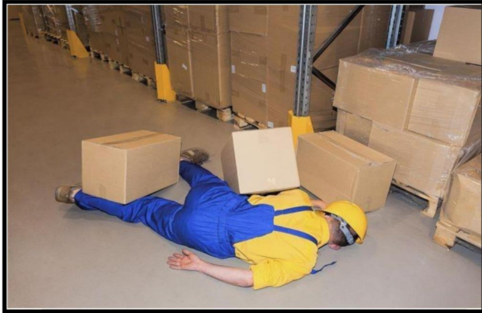
Gambar 4. Penyakit Akibat Kerja Tertimpa barang