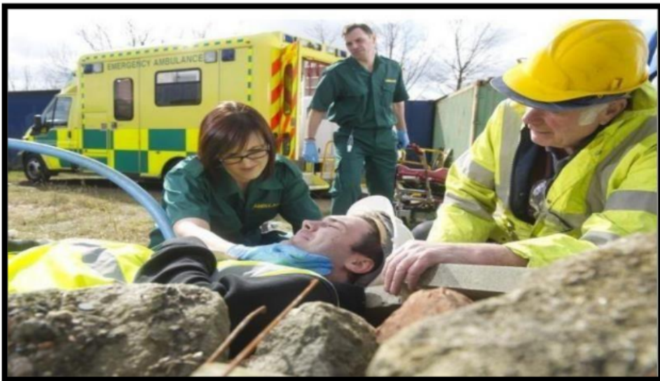
Gambar 7. Korban Kecelakaan Kerja