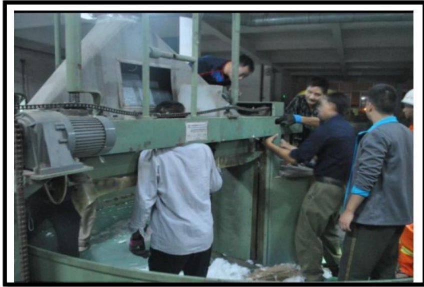
Gambar 2. Penyakit Akibat Kerja Terjepit Alat