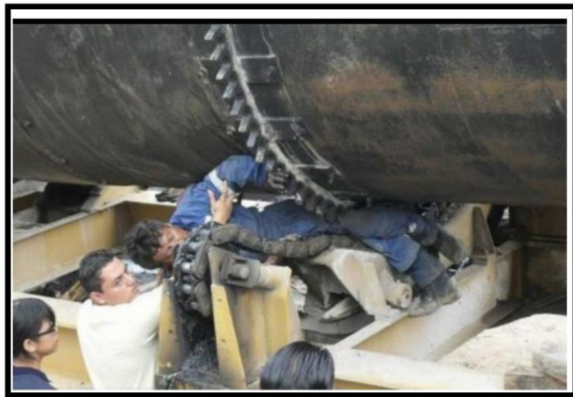
Gambar 3. Penyakit Akibat Kerja Tergiling Alat