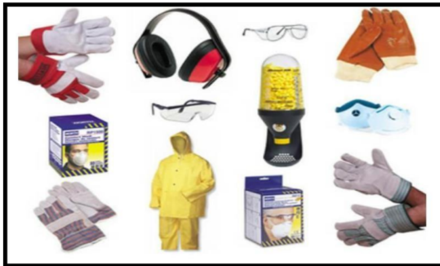
Gambar 8. Perlengkapan Safety