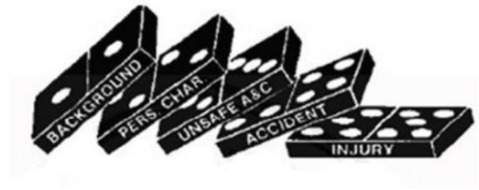
Gambar 1. Diagram Teori Domino

Kunci untuk mencegah kecelakaan adalah dengan menghilangkan tindakan tidak aman sebagai poin ketiga dari lima faktor penyebab kecelakaan. Menurut penelitian yang dilakukannya, tindakan tidak aman ini menyumbang 98% penyebab kecelakaan. Dengan penjelasannya ini, Teori Domino Heinrich menjadi teori ilmiah pertama yang menjelaskan terjadinya kecelakaan kerja. Kecelakaan tidak lagi dianggap sebagai sekedar nasib sial atau karena peristiwa kebetulan.