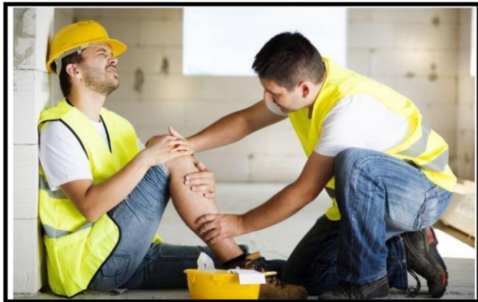
Gambar 5. Penyakit Akibat Kerja Terkilir