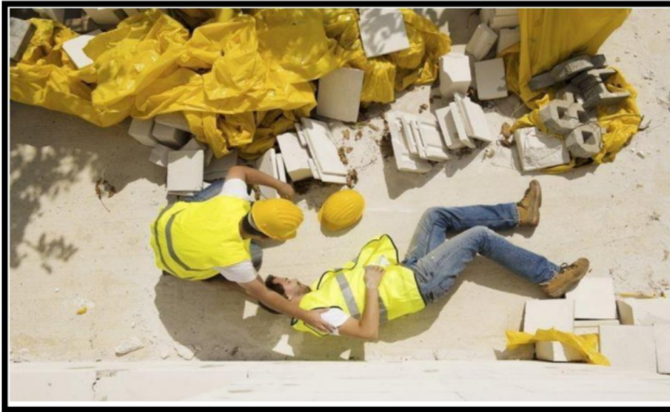
Gambar 6. Penyakit Akibat Kerja Terjatuh